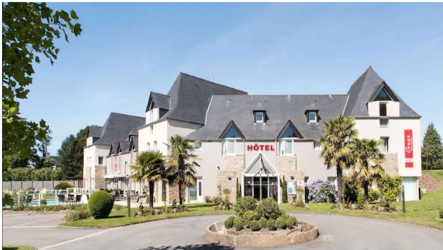
Hôtel des Ormes *** 44 chambres et 36 appartements