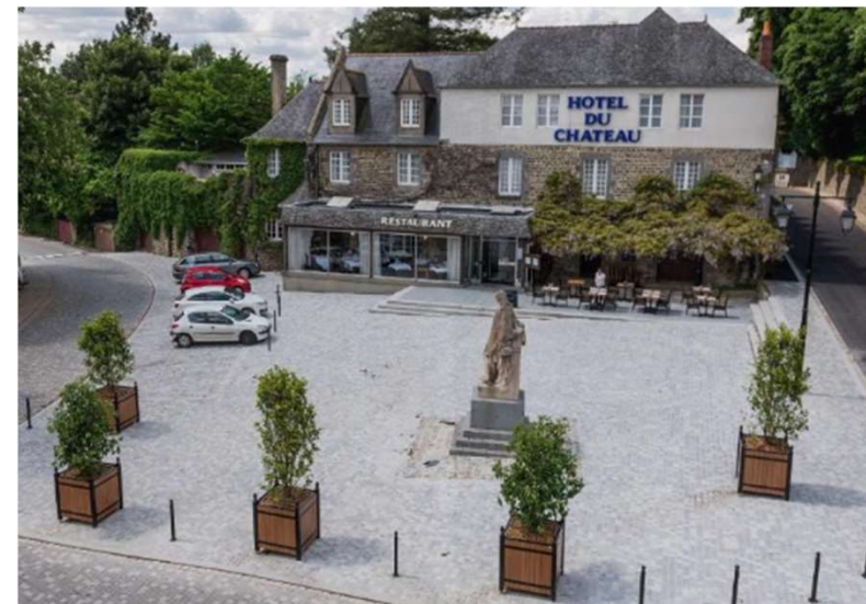
Hôtel du Château *** Combourg 32 chambres